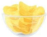
Bulvių, kukurūzų traškučiai