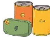
Konservuoti mėsos ir žuvies gaminiai