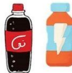
Gazuoti gėrimai, energiniai gėrimai